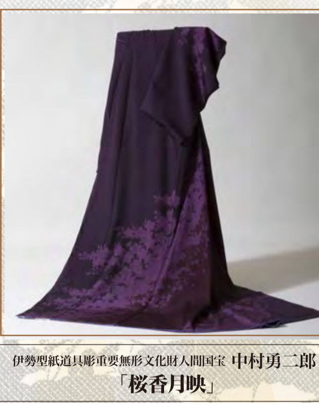
伊勢型紙道具彫重要無形文化財人間国宝 中村勇二郎 「桜香月映」