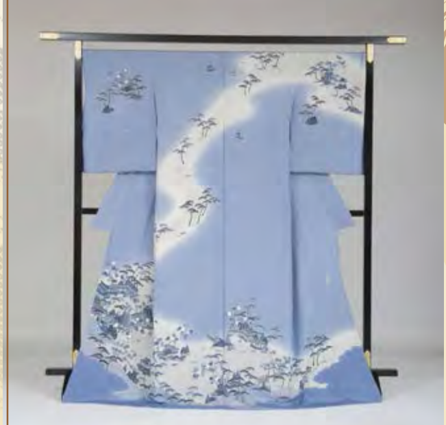
草木友禅 田村哲彦 「泰平楽日」