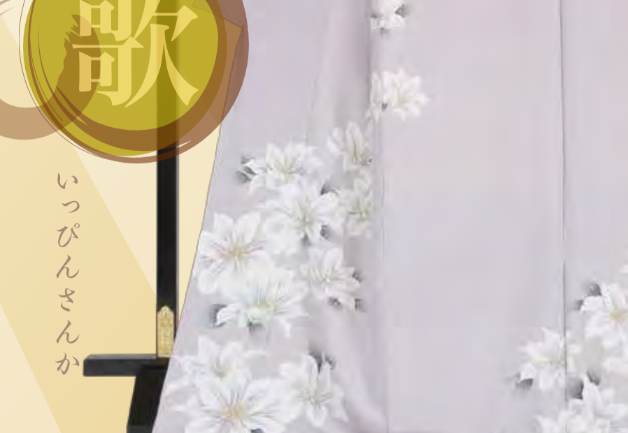
二代目 春宣 「佳日」